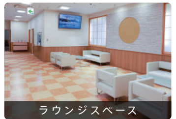
ラウンジスペース