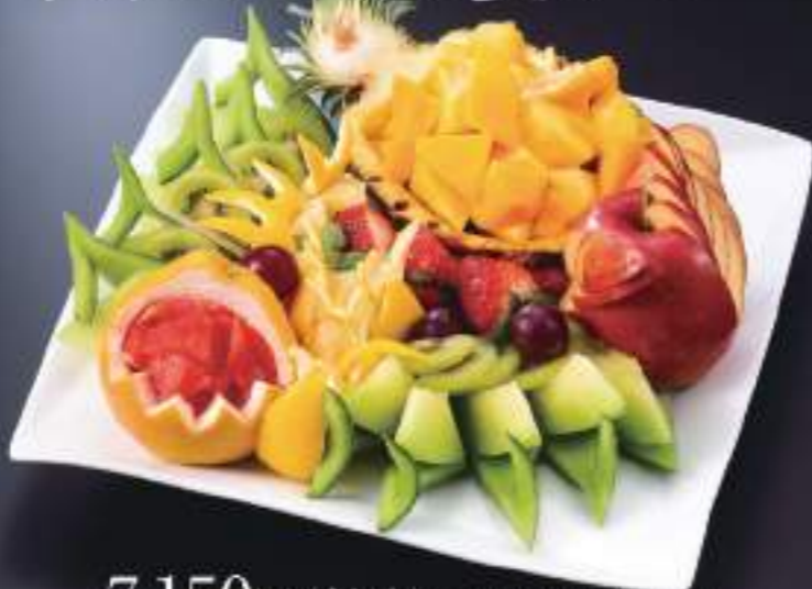
季節のフルーツ盛合せ 04796