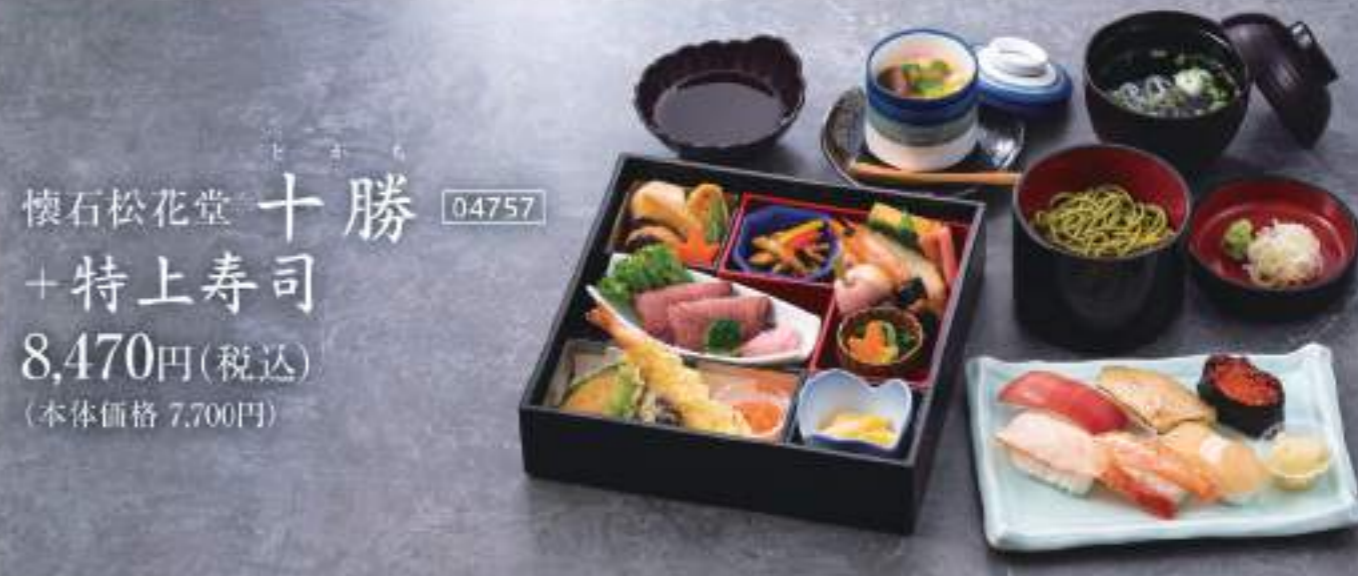
懐石松花堂 としかち 十勝 04757 + 特上寿司 8,470円(税込) (本体価格 7,700円)