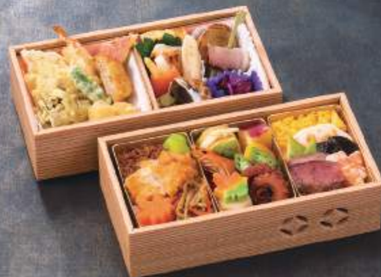
松花堂弁当 翼 04762