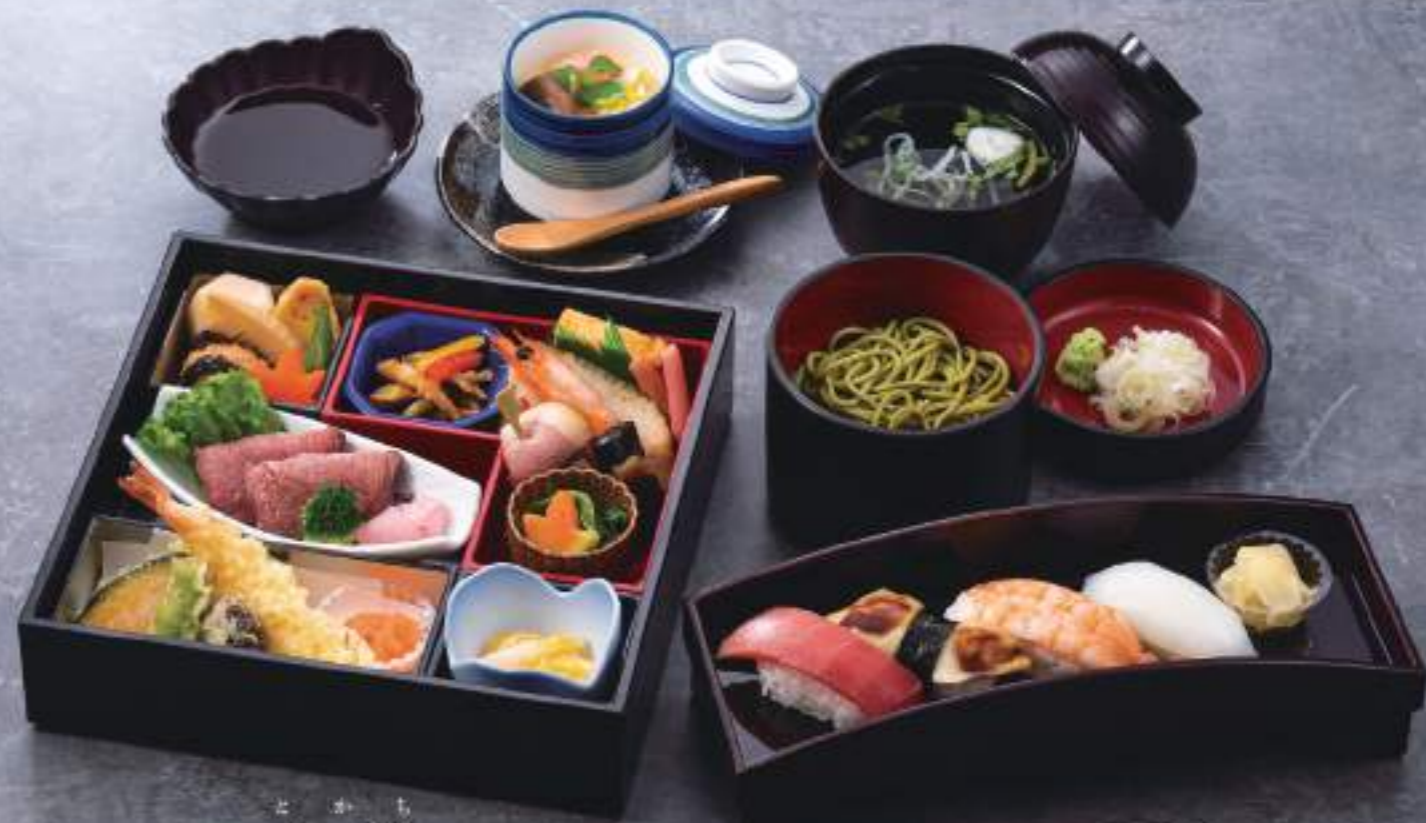
懐石松花堂 としかち 十勝 04755