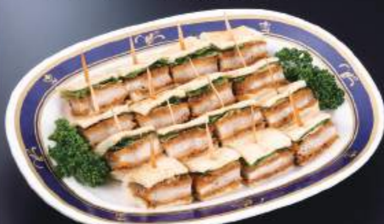
カツサンド盛合せ 04798