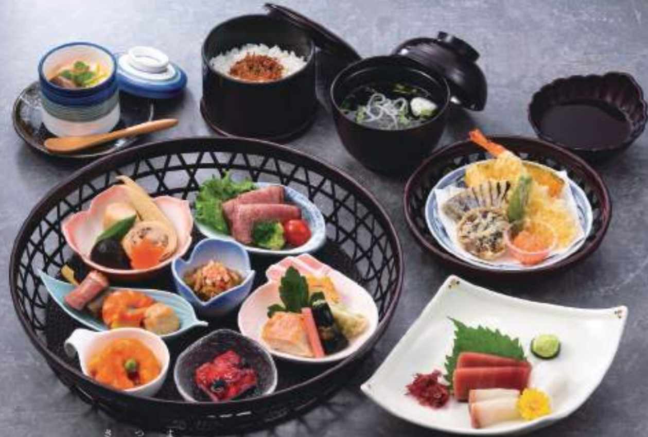
懐石松花堂 薩摩 04758