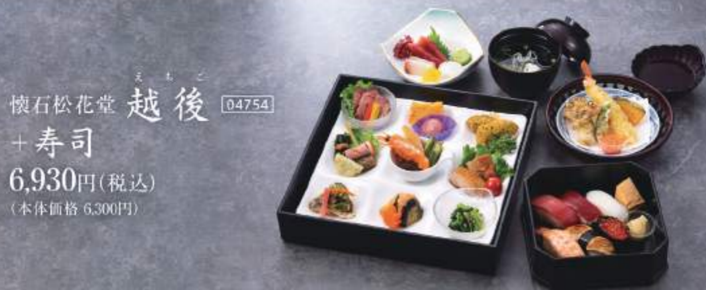
懐石松花堂 えちご 越後 04754 + 寿司 6,930円(税込) (本体価格 6,300円)