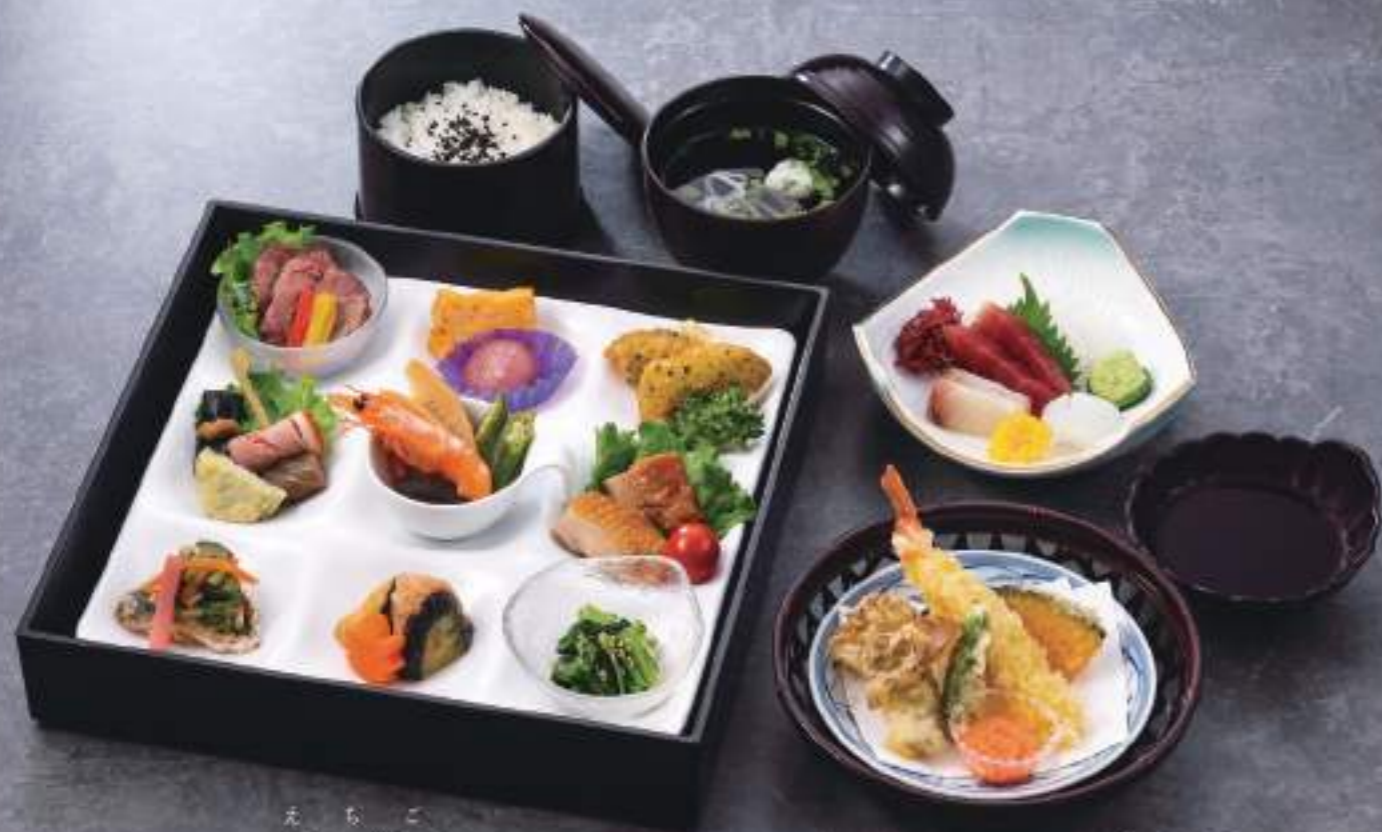
懐石松花堂 えちご 越後 04752