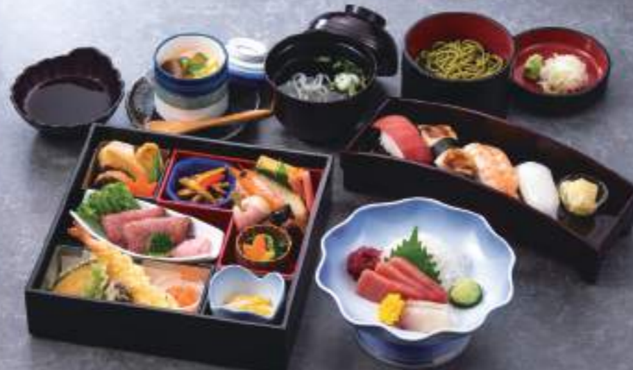
懐石松花堂 としかち 十勝 04756 + 刺身 7,040円(税込) (本体価格 6,400円)