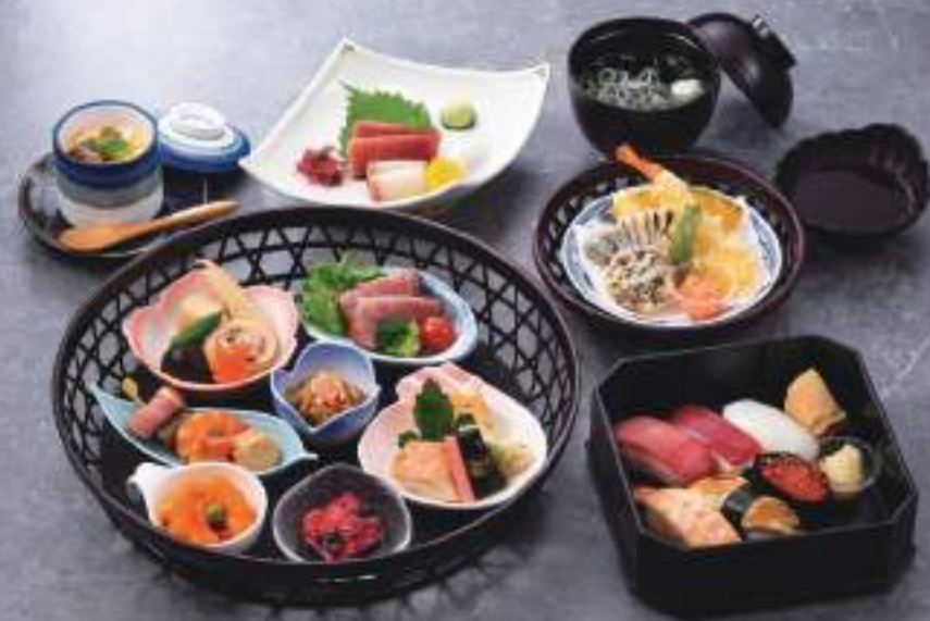
懐石松花堂 薩摩 04759

※お持ち帰りの場合は、軽減税率(8%)で販売することも可能です。詳しくは担当営業にお尋ねください。