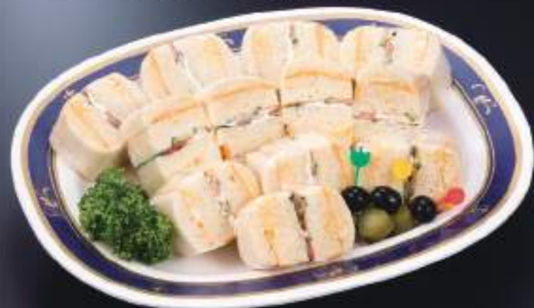
サンドイッチ盛合せ 04797