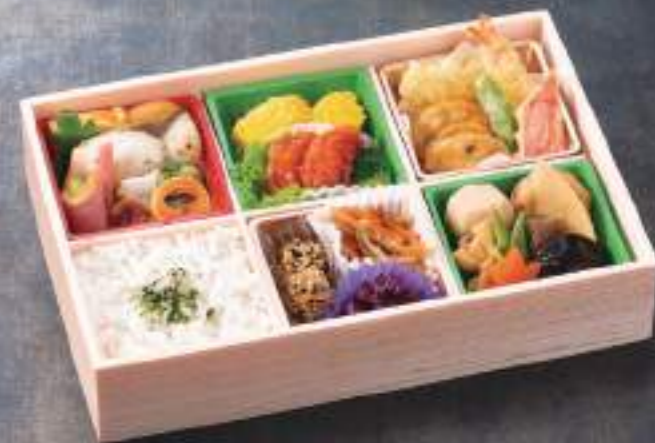
松花堂弁当 蒼 04763