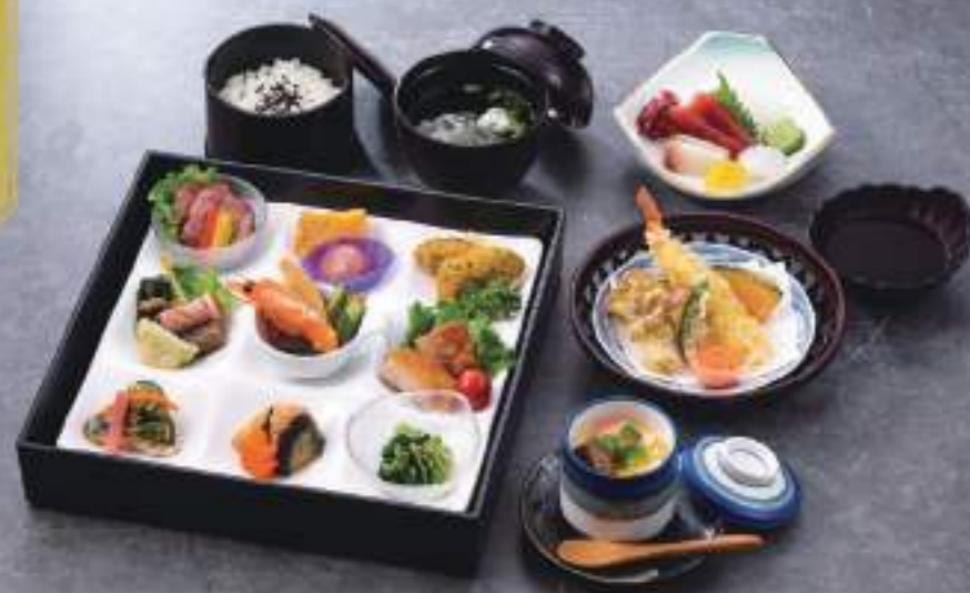
懐石松花堂 えちご 越後 04753 + 茶碗蒸し 5,500円(税込) (本体価格 5,000円)