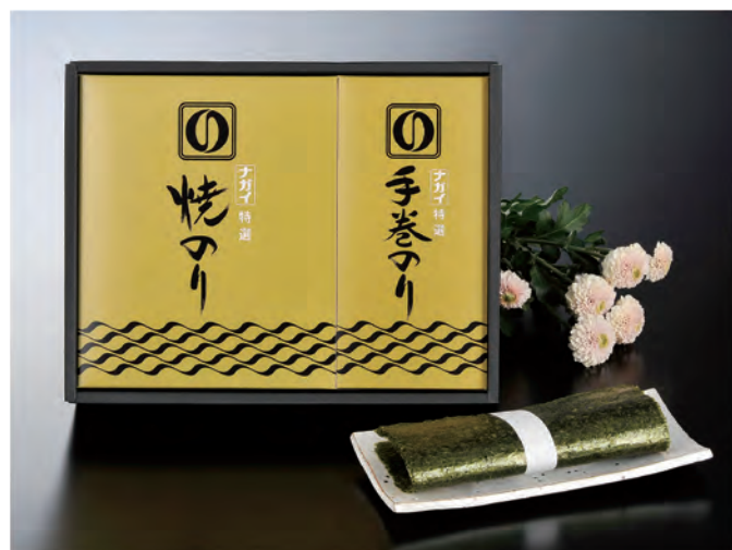
■ CY-DOR 税抜 4,000円 (税込 4,400円)

内容 / 焼のり板のり5枚×3袋、焼のり半切5枚×3袋 箱サイズ / 270×350×75mm 梱 / 10