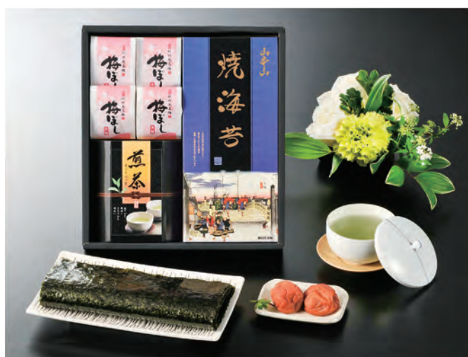
YC-COU 税抜 3,000円 (税込 3,300円)

内容 / 山本山焼海苔板のり8枚、川崎園静岡煎茶80g、旅館のおみそ汁9g×4袋、 紀州大粒梅干し1粒×4袋 箱サイズ / 275×375×50mm 梱 / 10