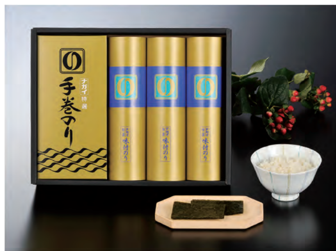
■ CY-EOR 税抜 5,000円 (税込 5,500円)

内容 / 焼のり半切5枚×4袋、味付のり8切60枚×3 箱サイズ / 270×350×75mm 梱 / 10