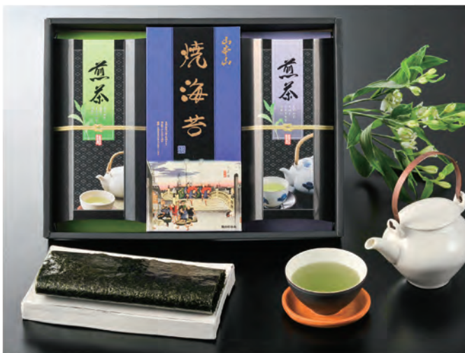
■ YC-DO 税抜 4,000円 (税込 4,400円)

内容 / 山本山焼海苔板のり8枚、川崎園静岡煎茶80g、川崎園静岡煎茶100g 箱サイズ / 275×375×50mm 梱 / 10