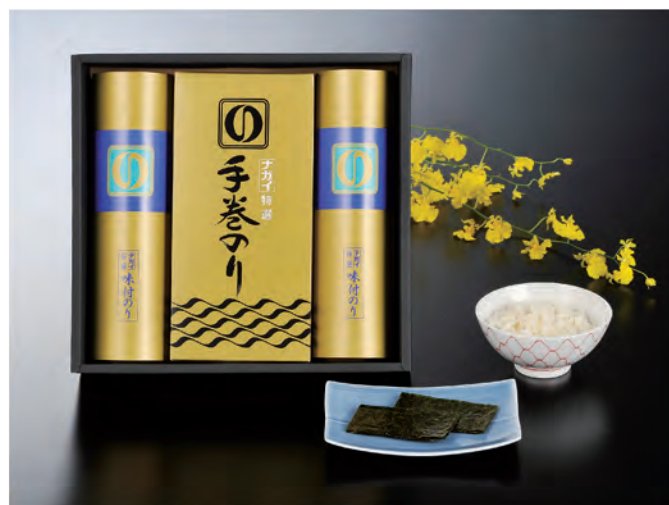
■ CY-COR 税抜 3,000円 (税込 3,300円)

内容 / 焼のり板のり5枚×3袋、焼のり半切5枚×3袋 箱サイズ / 270×350×75mm 梱 / 10