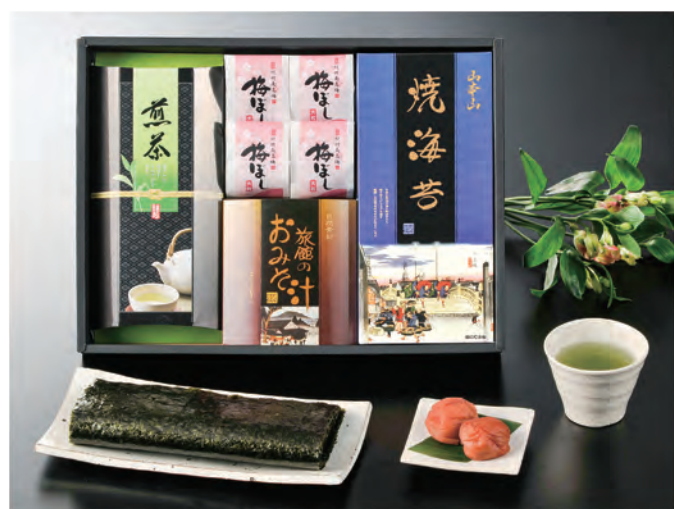
YC-DOU 税抜 4,000円 (税込 4,400円)

内容 / 山本山焼海苔板のり8枚、川崎園静岡煎茶100g、 旅館のおみそ汁9g×4袋、紀州大粒梅干し1粒×6袋 箱サイズ / 275×375×50mm 梱 / 10