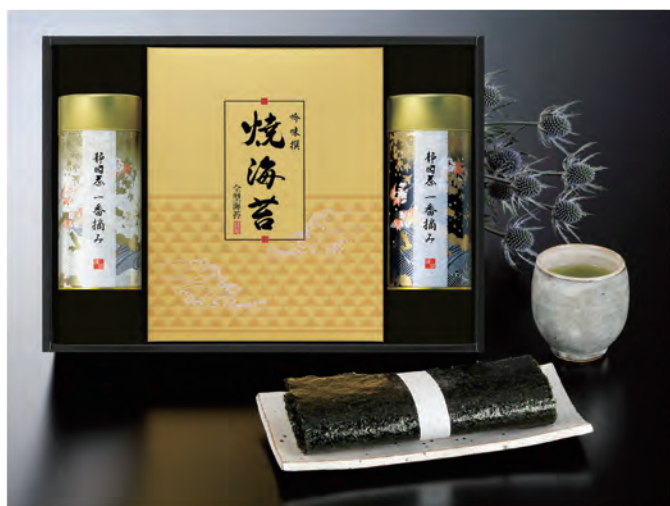
■ ON-EOA 税抜 5,000円 (税込 5,500円)

内容 / 焼海苔板のり5枚×3袋、 静岡煎茶(白)80g、静岡煎茶(黒)100g 箱サイズ / 270×375×80 mm 梱 / 10