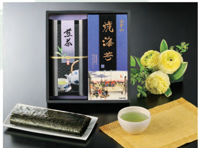
■ YC-CO 税抜 3,000円 (税込 3,300円)

内容 / 山本山焼海苔板のり8枚、川崎園静岡煎茶80g、川崎園静岡煎茶100g 箱サイズ / 275×375×50mm 梱 / 10