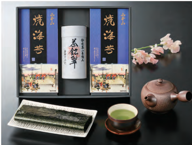
■ YC-EOR 税抜 5,000円 (税込 5,500円)

内容 / 山本山焼海苔板のり8枚×2、栗原園静岡煎茶100g 箱サイズ / 270×345×80mm 梱 / 10