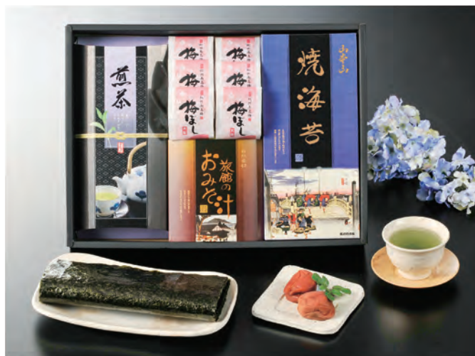
YC-EOU 税抜 5,000円 (税込 5,500円)

内容 / 山本山焼海苔板のり8枚、川崎園静岡煎茶100g、 旅館のおみそ汁9g×4袋、紀州大粒梅干し1粒×6袋 箱サイズ / 275×375×50mm 梱 / 10