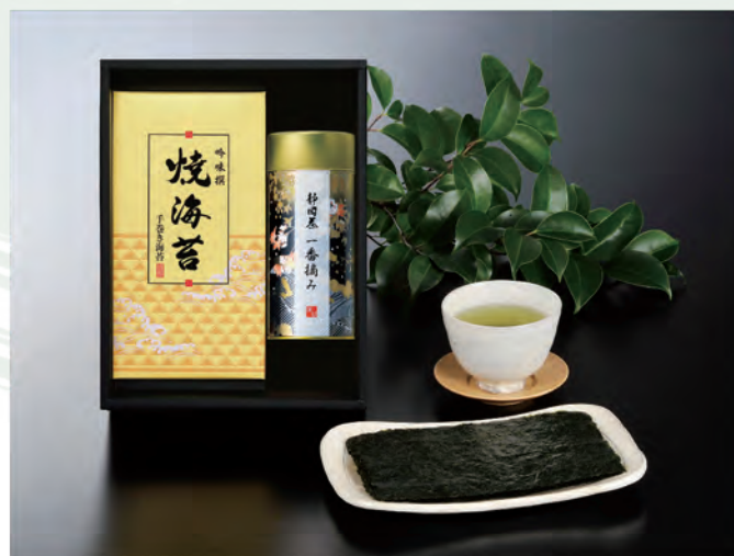
■ ON-COA 税抜 3,000円 (税込 3,300円)

内容 / 焼海苔板のり5枚×3袋、静岡煎茶(黒)100g 箱サイズ / 275×295×80 mm 梱 / 10