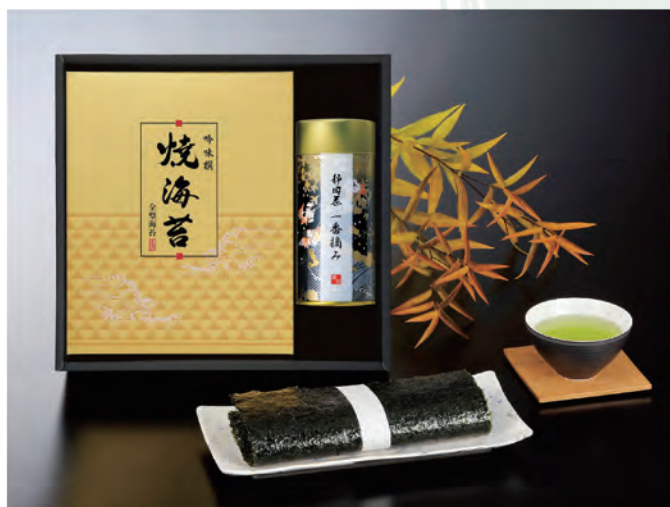
■ ON-DOA 税抜 4,000円 (税込 4,400円)

味、香り、どれをとっても完璧な、 茶匠の技と心で大切に育んだ真味の静岡茶。 日本伝統の味でもある海の幸の 焼海苔の厳選された逸品をお届けします。